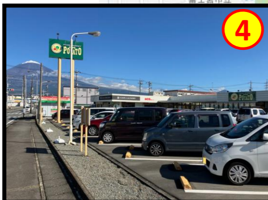
ポテト野中店 車で約2分