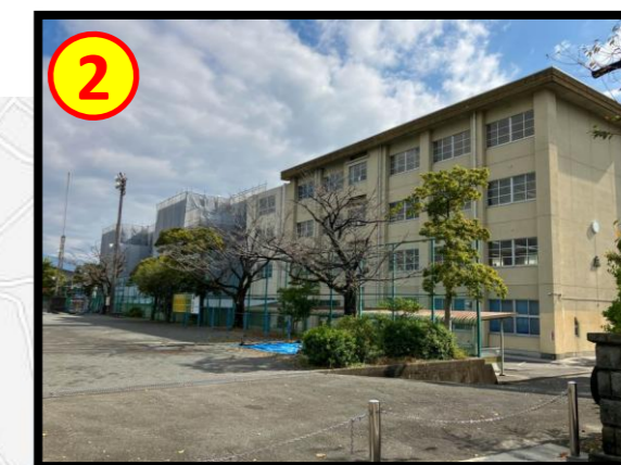
富士宮第一中学校 徒歩 約30分