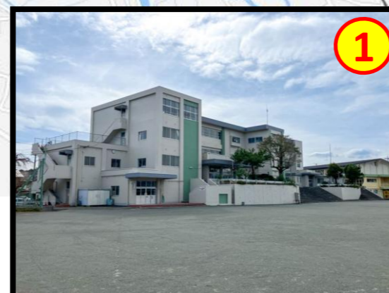
黒田小学校 徒歩 約3分