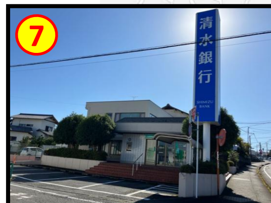
清水銀行野中支店 車で約2分