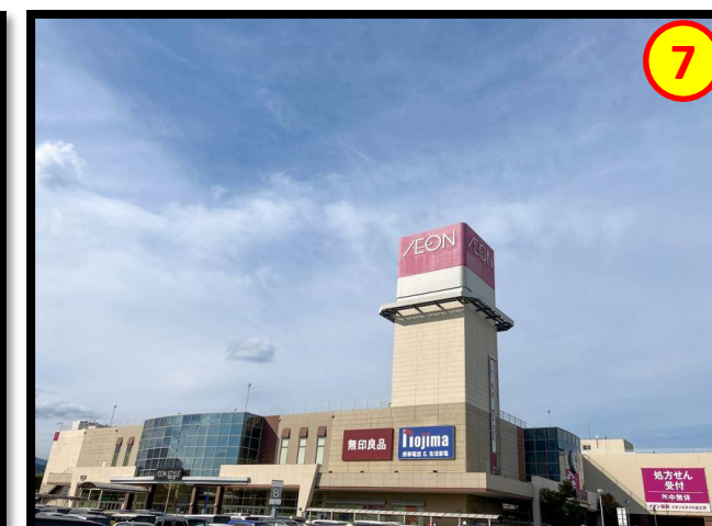
イオンモール富士宮 車で約7分