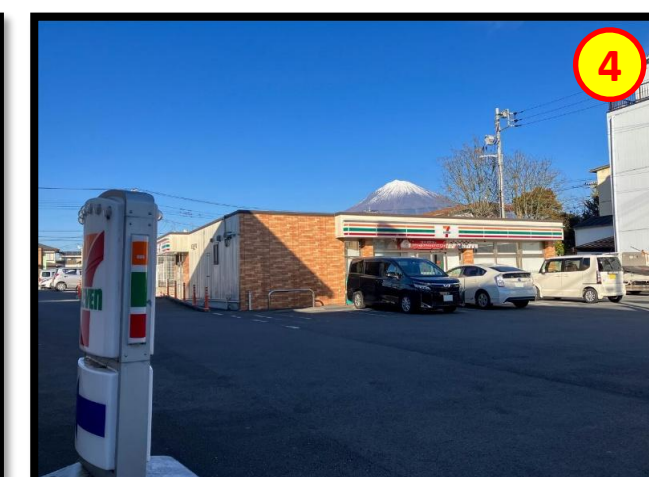
セブンイレブン富士宮西町店 徒歩約7分、車で約2分