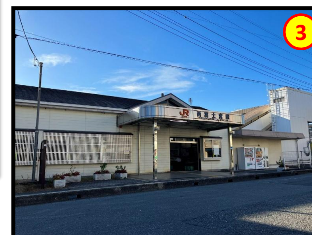
西富士宮駅 徒歩約5分