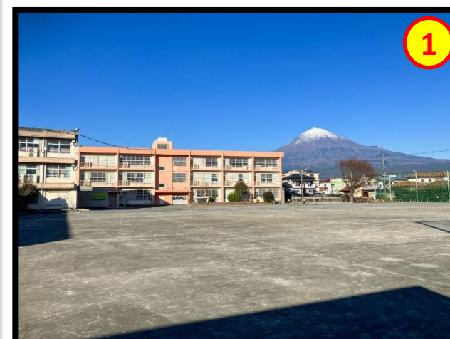
貴船小学校 徒歩約3分