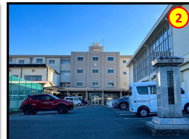
富士宮第三学校 徒歩約17分