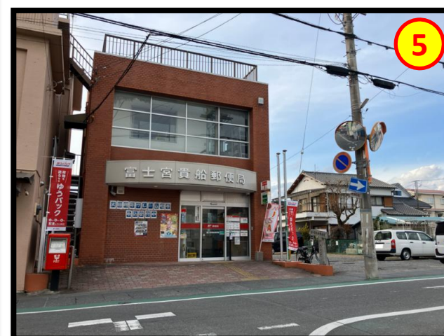
富士宮貴船郵便局 徒歩約2分