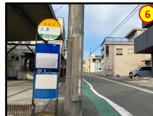
バス停『貴船町』 徒歩約1分